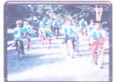
ปั่นจักรยานชมบ้านทรงไทย