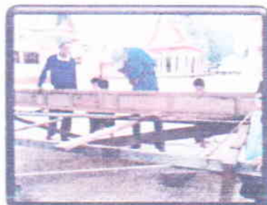
ช่างปรุงบ้านเรือนไทย