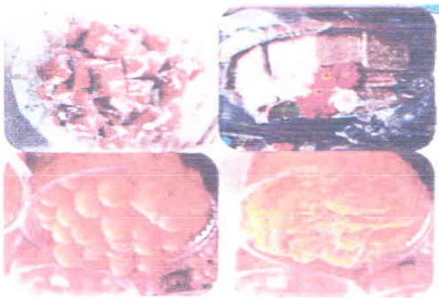
ឧបសម្ព័ន្ធគ្រឹក្សាភ្នំពេញ