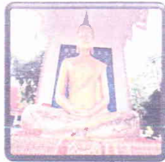
พระพุทธรูปสี่

เวลา 13.00น.- สัมผัสวัฒนธรรมเก่าแก่น่าค้นหา บรรยายทศบ้านทรงไทยที่แวดล้อมด้วยธรรมชาติที่ อุดมสมบูรณ์และ วิถีชีวิต ของชาวไผ่ดำพัฒนา ชมศูนย์เรียนรู้เกษตรเศรษฐกิจพอเพียง