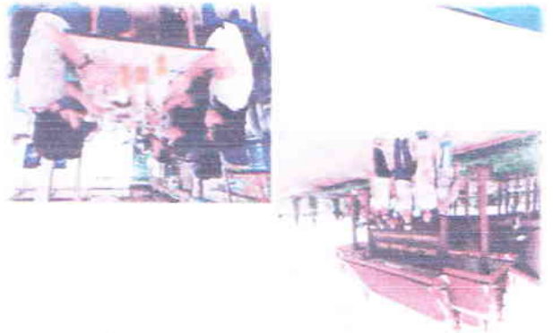
ក្រុមប្រឹក្សាស្រុកស្រែចម្ការស្រុកស្រែចម្ការ