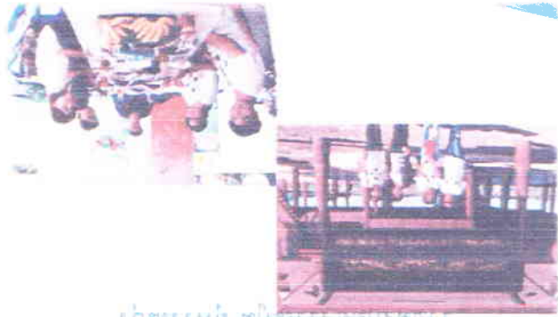
ក្រុមប្រឹក្សា រដ្ឋបាលស្រុកស្រែចម្ការ ទេសភូមិវិទ្យាល័យស្រែចម្ការស្រុកស្រែចម្ការ