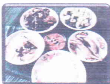
อาหารพื้นบ้านของไผ่ดำ