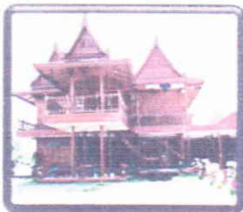
บ้านทรงไทย