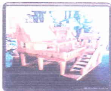
แบบจำลองบ้านทรงไทย