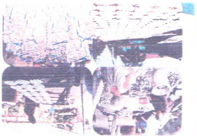
កងកម្រងទឹកភ្នំពេញ