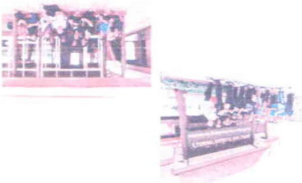
ក្រុមប្រឹក្សាស្រុកស្រែចម្ការស្រុកស្រែចម្ការ