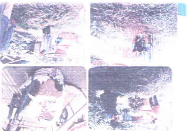
កងកម្រងទឹកភ្នំពេញ