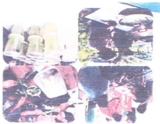
កងកម្រងទឹកភ្នំពេញ