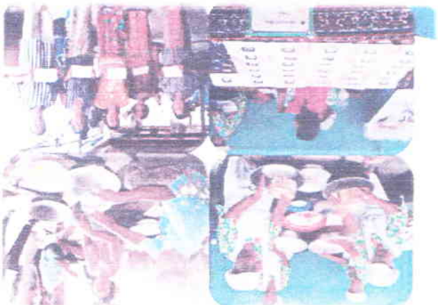
កងកម្រងទឹកភ្នំពេញ