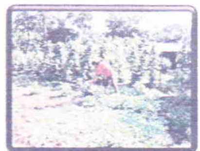
การปลูกผักปลอดสารพิษ