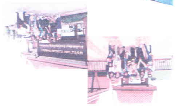
ក្រុមប្រឹក្សាស្រុកស្រែចម្ការស្រុកស្រែចម្ការ

ក្រុមប្រឹក្សាស្រុកស្រែចម្ការ ក្រុមប្រឹក្សាស្រុកស្រែចម្ការ ក្រុមប្រឹក្សាស្រុកស្រែចម្ការ ក្រុមប្រឹក្សាស្រុកស្រែចម្ការ